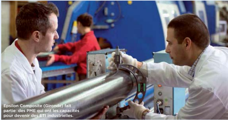
Epsilon Composite (Gironde) fait partie des PME qui ont les capacités pour devenir des ETI industrielles.

Le conseil régional fait des ETI industrielles (entreprises de taille intermédiaire) le cheval de bataille contre la désindustrialisation. Un plan d'actions pour la période 2013-2016 a été voté lors de la dernière assemblée plénière.