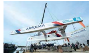
Le trimaran Arkema - Région Aquitaine de Lalou Roucayrol : symbole du transfert technologique et de l'innovation.

En décembre 2013 aura lieu le premier forum de l'innovation globale* à l'Aérocampus de Latresne (Gironde). Cet événement unique et d'envergure nationale mis en place par la Région Aquitaine et Aquitaine Développement Innovation aura pour but de créer des échanges autour de la thématique « Innover autrement ». Le forum abordera à la fois le côté scientifique et la prospective, mais également les applications de la recherche avec la participation de nombreuses entreprises, véritables « écosystèmes d'innovation ».