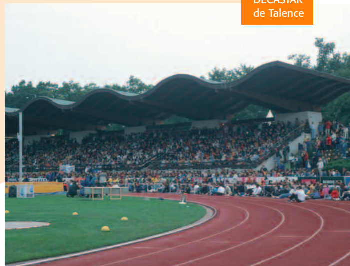
DECASTAR de Talence

Une initiative du Conseil Général qui permet à des jeunes... d'aller encourager leurs joueurs préférés.