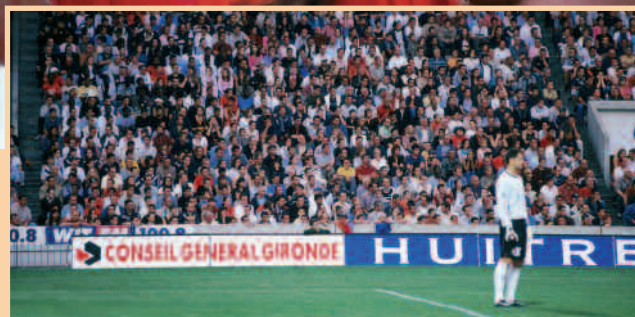
Opération Jeunes au stade lors d'un match des Girondins de Bordeaux